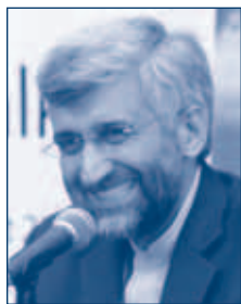
El principal negociador iraní, Saeed Jalili, se estancó durante las conversaciones sobre la temática nuclear.

A fin de demostrar su sincera voluntad de llegar a una solución diplomática, Estados Unidos envió al subsecretario de estado William Burns a una reunión celebrada en Ginebra para debatir la propuesta de Solana con los negociadores iraníes.